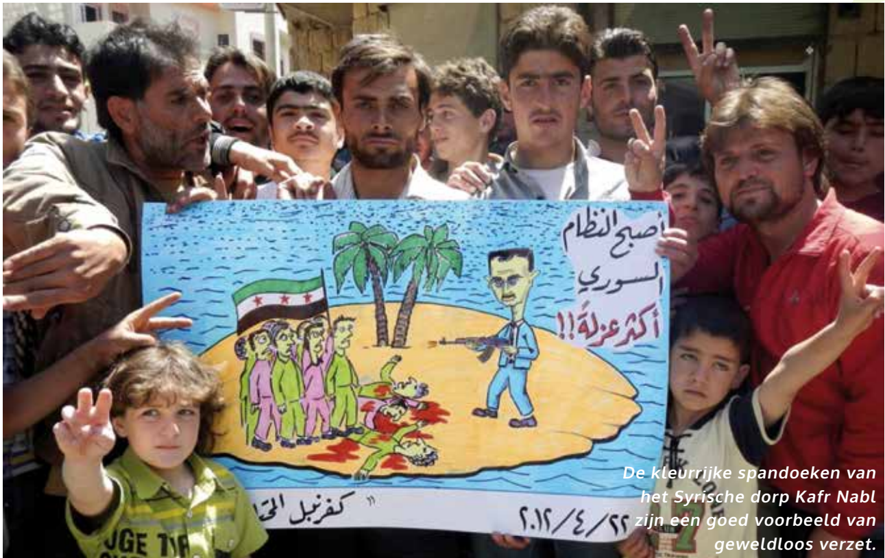
De kleurrijke spandoeken van het Syrische dorp Kafr Nabl zijn een goed voorbeeld van gewelddoos verzet.