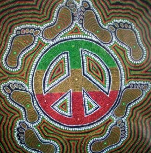
Ieder jaar organiseert de Raad van Kerken in een andere stad van Nederland de 'Walk of Peace'.

De Raad van Kerken in Nederland volgde de Wereldraad in de aandacht voor geweldloosheid. De Assemblée van Busan in 2013 riep de lidkerken op tot een 'Pelgrimage van Gerechtigheid en Vrede'. Dat houdt in: opnieuw getuigen van het gedeelde geloof dat oproept actief gerechtigheid, vrede en heelheid van de schepping te zoeken. In het kader van die Pelgrimage wordt ieder jaar een Walk of Peace gehouden, telkens in een andere stad in ons land, waarbij met name beoogd wordt bruggen te slaan tussen verschillende geloofsgemeenschappen en bevolkingsgroepen.