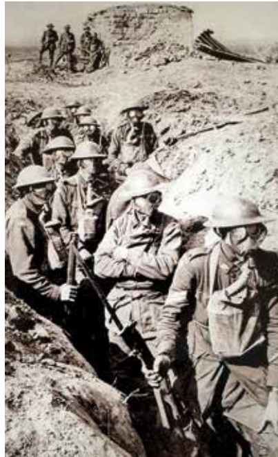
De Eerste Wereldoorlog deed Heering inzien dat oorlog en het christelijk geloof niet met elkaar te rijmen zijn.

Zo onderbouwt Heering zijn omkeer. Dat doet hij grondig. Hij is op de hoogte van de politieke situatie. Hij duikt in de literatuur