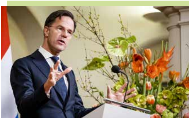
In 2023 erkent premier Rutte dat Nederland excessief geweld gebruikte in de oorlog tegen Indonesië.

op demonstranten! Langs de spoorweg die soldaten vervoerde naar de kust om in te schepen, stonden op regelmatige afstand soldaten om vluchten te voorkomen. De CPN was de enige politieke partij die tegen deze oorlog had gestemd. In 1945 nog de helden van het land omdat zij een belangrijke kern van het verzet hadden gevormd, werd de CPN vanaf 1946 partij non grata vanwege deze weigering. Indonesië-weigeraars wensten niet in Indonesië te doen wat de 'moffen' hier hadden gedaan.