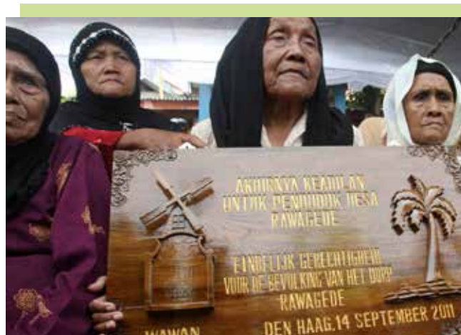
In 1947 vindt een massamoord plaats in Rawagede: 431 jongens en mannen worden afgevoerd en vermoord.

Binnen Nederland was de stemming verdeeld. In 1946 is 44 procent van de bevolking voor troepenverzendingen, 42 procent tegen; op 24 september 1946 zijn er in heel Nederland protestacties en -stakingen. De politie vuurt