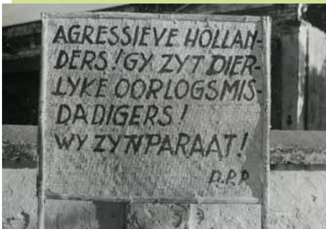
Een bord afkomstig van de TNI (Indonesische Nationale Leger).

Heering spreekt over een progressieve Nederlandse regering (kabinet-Beel 1946-1948, bestaande uit KVP en PvdA) die er in zou slagen dat de opstand tegen Nederland goed opgevangen zou worden en zou leiden tot samenwerking met de Republiek. Dat gebeurde niet. Binnen Nederland was een sterke stroming die 'Ons Indië' wilde behouden en de confrontatie met de nieuw gevormde Indonesische Republiek wilde aangaan. De opbouw van de Nederlandse oorlogsmacht voedde extremistische krachten binnen de Indonesische Republiek. Toen de onderhandelingen tussen Nederland en de republikeinse regering mislukten kreeg generaal Spoor de vrije hand en brak het oorlogsgeweld los. Heering spreekt bewust niet over 'politieone actie', maar over oorlog.