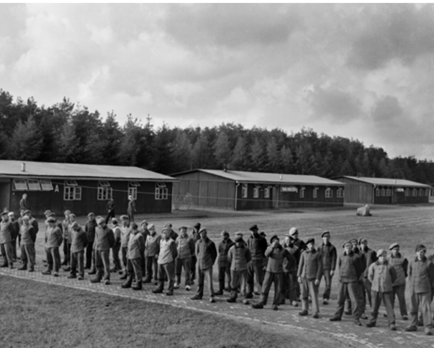
Indië-weigeraars op appèl in gevangenis Bankenbosch in Veenhuizen.

Maar je kunt ook lezen dat enkelen van hen het waagden om over de oorlogsmisdaden van Nederlandse kant in tijdschriften en bladen te schrijven. Zij werden vervolgens hardhandig teruggefloten. Een RK-missionaris werd geheel tegen zijn zin overgeplaatst naar een andere standplaats. Voortaan moesten mensen via de hoofdaalmoezenier of via de hoofdpredikant aangeven dat ze naar buiten wilden treden. Dit leidde er toe dat over dit onderwerp vooral nog werd gecorrespondeerd, zodat de wandaden wel doorsijpelden in Nederland.