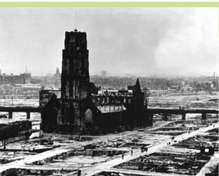
Strijd: 'We zijn vrij, maar zijn we die vrijheid waard?'

Was Nederland een christelijk volk te midden van andere volken? Zijn we gelouterd door wat we meemaakten? Hier komt Strijd te spreken over vergeving. Maar daarnaast is er ook de opdracht van Godswege, gekleurd door die tekst uit Mattheus 23. Strijd werkt dat in verschillende richtingen uit.