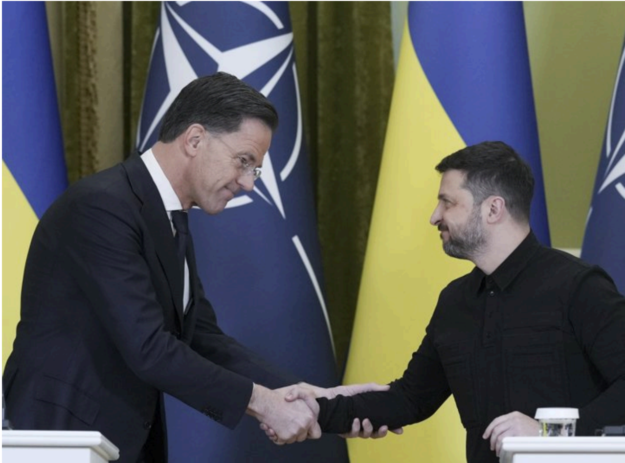
Secretaris-generaal van de Navo Mark Rutte en president Zelensky in Kiev, begin februari

“Als het om kernwapens gaat, is Europa veruit in het nadeel. Rusland en de VS bezitten negentig procent van de mondiale -kernwapens. Dat zijn illegale massavernietigingswapens die allang de wereld uit hadden moeten zijn. Voor de EU betekent het: inzetten op afbouw en inperking, te beginnen met het verlengen van het START-akkoord, dat begin februari is afgelopen. Zelf kernwapens maken is voor iedereen het slechtste wat Europa maar kan doen.”