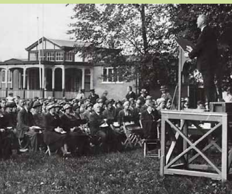
Openluchtbijeenkomst van Kerk en Vrede in 1935 in Dordrecht.