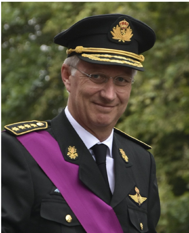
Koning Filip noemde de oorlog in Gaza 'een schande voor de mensheid'.

En nu zit Willem-A. in paleis Noordeinde te dubben. Na zeventig jaar excuses aanbieden voor de barbaarse onderdrukking van een vrijheidslievend eilandenrijk aan de andere kant van de wereld, daar konden we ons geen buil meer aan vallen. De slavernij is iets langer geleden en we vroegen ons af: 'Doet ie 't wel of doet ie 't niet'? Maar Willem-A. weet dat ook koningen moeten buigen voor de winden van verandering. Dus verwelkomde hij in zijn Haags B&B met een glimlach de man die vluchtelingen hun huis uit jaagt en ziekenfonds patiënten hun Medicaid afneemt.