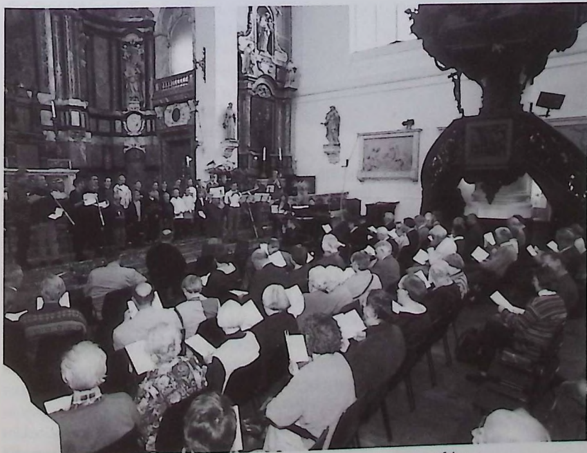
Kerk & Vrede luistert naar de mantel van geefdoor