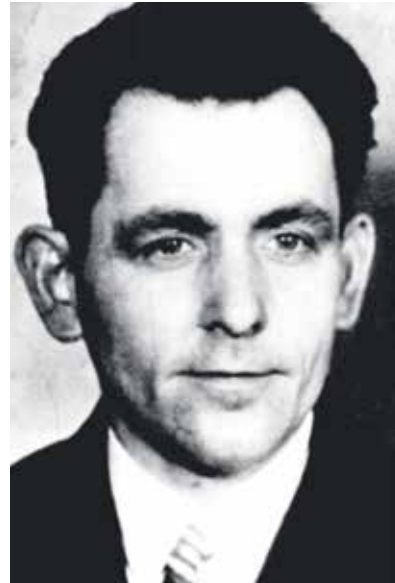
Johann Georg Elser.

Elser zag de mogelijkheid voor een aanslag in de Bürgerbräukeller in München. Adolf Hitler, Joseph Goebbels, Rudolf Hess, Heinrich Himmler en andere nazi-'hoge pieten' hadden de gewoonte om daar elk jaar op 8 november samen te komen om hun eigen mislukte staatgreep te herdenken. Op diezelfde datum namelijk hadden ze die in 1923 uitgevoerd in de hoop daarmee de Weimar-republiek omver te werpen. De Putsch mislukte, was dan ook slecht