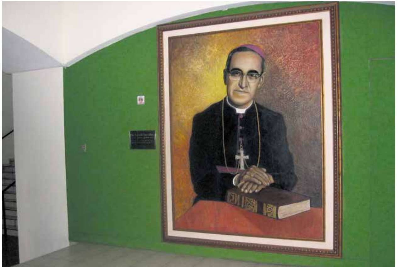
Boven zijn graf tombe, in de crypte van de kathedraal van San Salvador, hangt het portret van Oscar Arnulfo Romero y Galdámez (1917-1980). Hij was aartsbisschop van San Salvador sinds 1977 en werd in 1980 tijdens een kerkdienst vermoord. Op 23 mei jl. is hij zalig verklaard.

Ik ben nu in El Salvador en vandaag bezochten we alle plekken die intens met Romero verbonden zijn. Overal op deze plekken lopen camerateams die mensen interviewen. En de verschillen tekenen zich af. We waren als laatste in het hospitalito , het kleine zie-