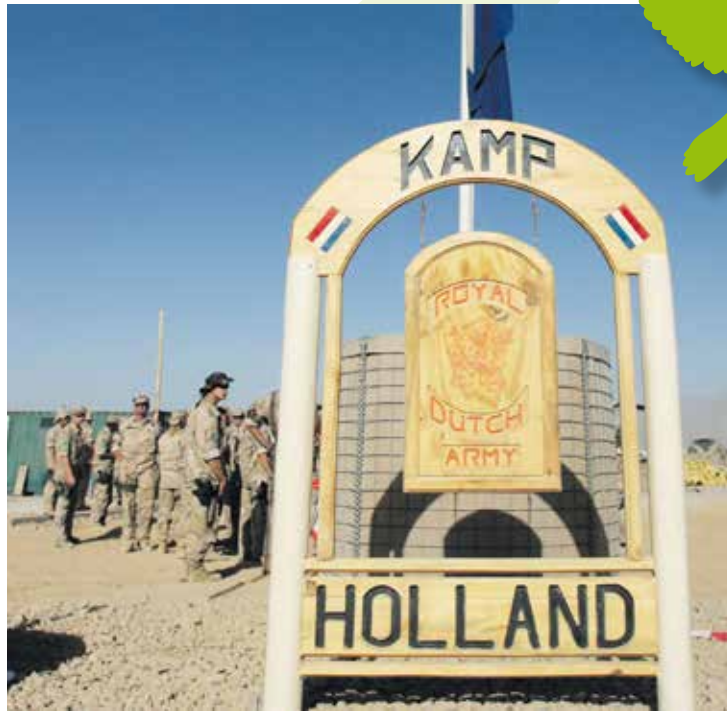
Jongstleden maart brachten de ministers Jeanine Hennis-Plasschaert van Defensie en Bert Koenders van Buitenlandse Zaken een bezoek aan de Nederlandse militairen in Mazar-e-Sharif, Noord-Pakistan.