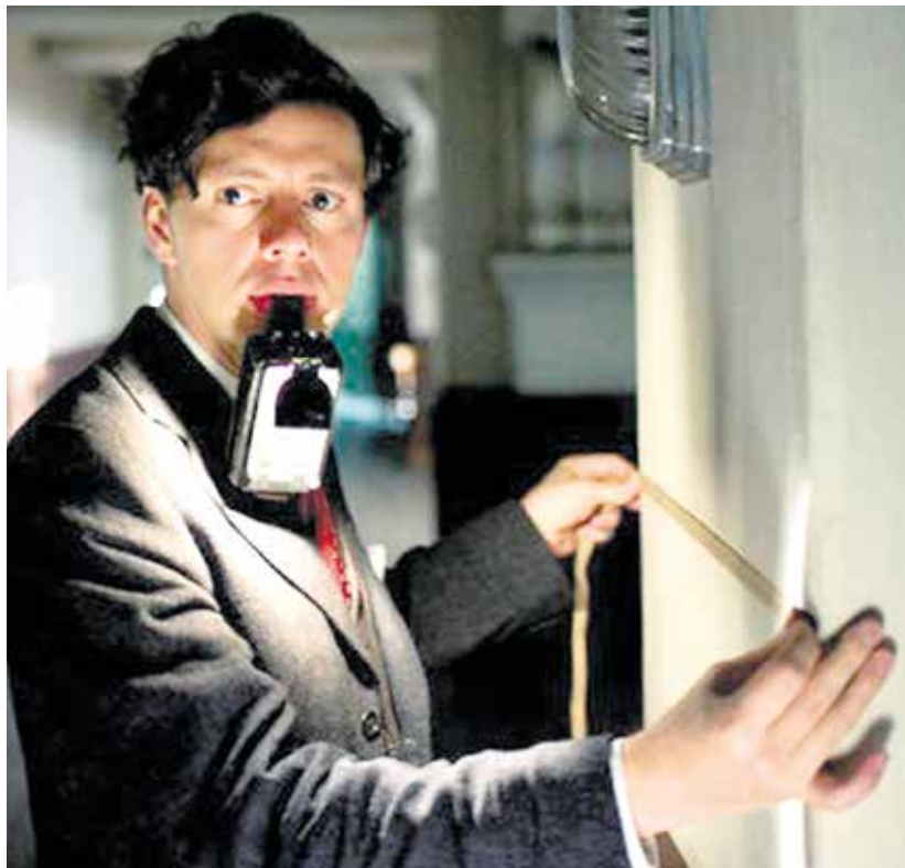
Elser installeert de bom in de kelder. Still uit de recente film "Elser - Er hätte die Welt verändert".

der in te bouwen. Perfectionist als hij was zette hij, voor het geval de tijd klok toevallig stil zou blijven staan, er een reserveklok bij. Om te voorkomen dat de gasten het tikken van de klokken zouden kunnen horen ver-