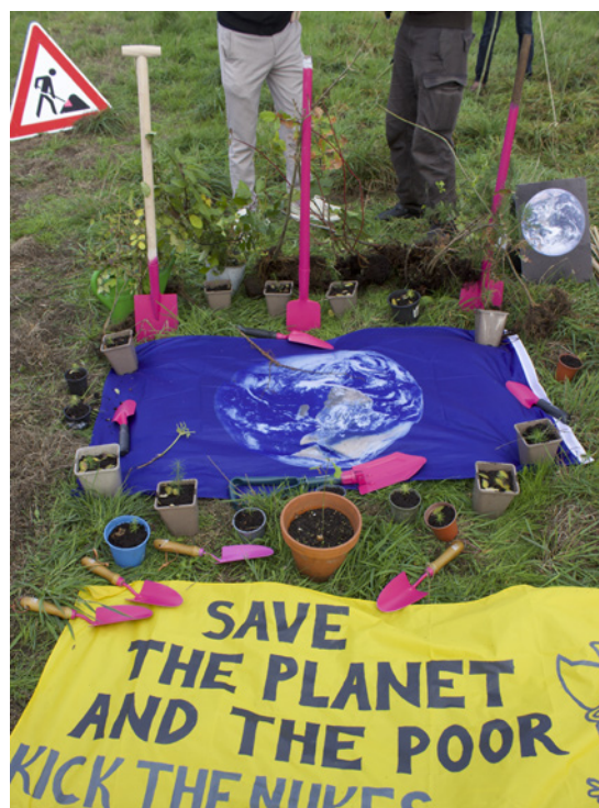
De kleur van de roze spades staat symbool voor geweldloosheid.

Na een korte picknickpauze gaan we daadwerkelijk vrede scheppen. Vijf mensen lopen langzaam met roze schoppen in de hand naar het hek, waar