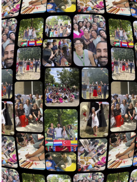
Ontmoetingen van mens tot mens kunnen een daad van liefde zijn.

Gaandeweg begreep ik dat Servas overal ter wereld wordt beleefd als een vreedzame ontmoetingsplaats: een plek voor dialoog, verbinding en begrip tussen volkeren. Zonder politieke agenda en zonder religieuze richting. Eigenlijk een vredesbeweging avant la lettre .