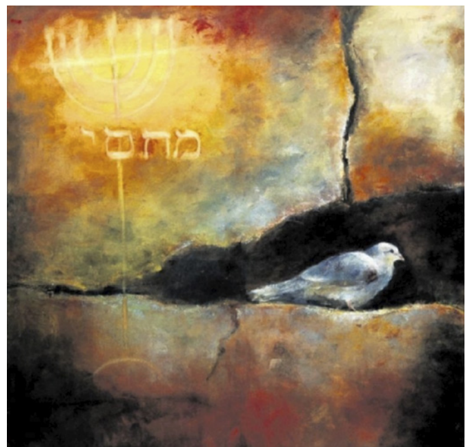
Ik zing mezelf een psalm binnen.

voorzitter van de Theologische Werkgroep van Kerk en Vrede