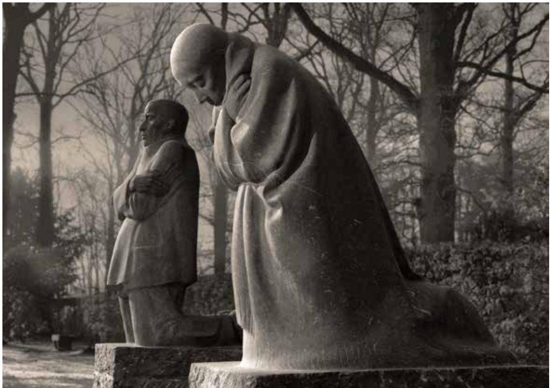
Käthe Kollwitz, 'Trauernde Eltern', installatie op de militaire begraaf- plaats van Vladslo.

Over haar positie als kunstenaar in oorlogstijd is zij in 1916 wel heel duidelijk: 'Men kan van een kunstenaar, die ook nog eens vrouw is, niet