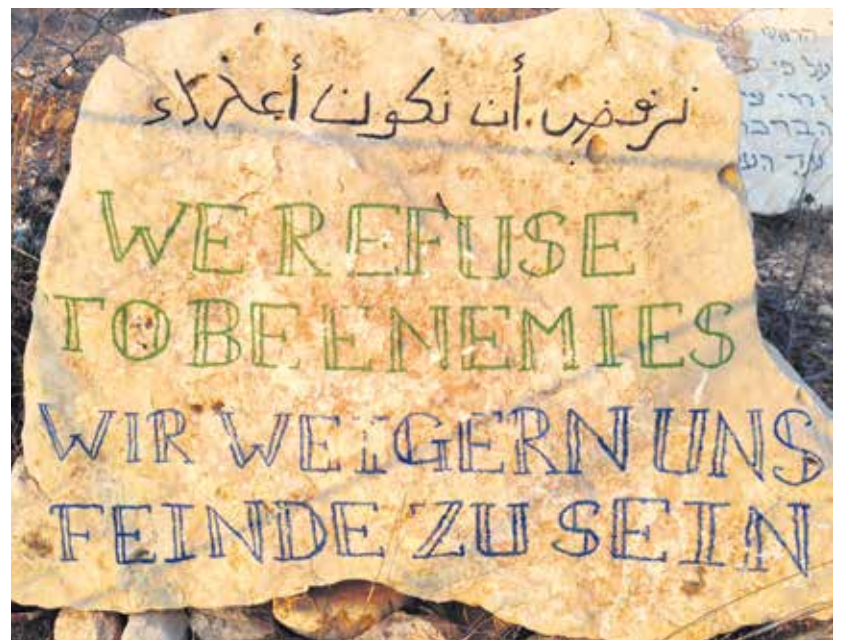
Het devies van de familie Nassar: “Wij weigeren vijanden te zijn.”