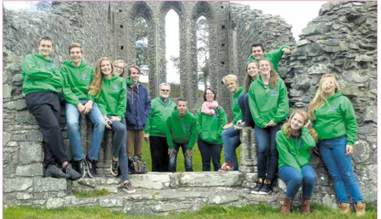
Bij de evaluatiebijeenkomst bleek, dat de reis de blik verruimd heeft.

De dagopeningen en de excursies hielden meer in dan alleen lessen bijwonen op de interreligieuze school Shimna College in Newcastle, of daar samen voetballen. Bij aankomst werd de zegenbede van St. Patrick gelezen. De programma's waren bedoeld om 'ver-