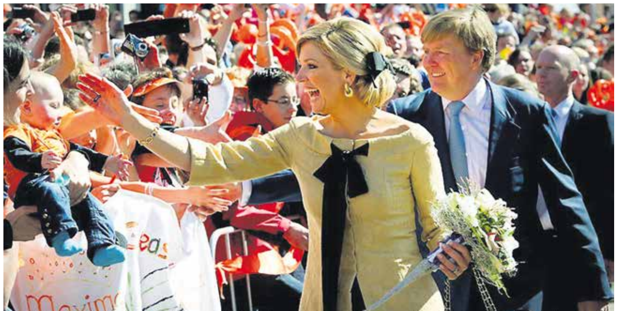
Kunnen op Koningsdag vorst en vorstin min of meer onbeveiligd over straat?

ving waarin wat meer boeven of zo rondlopen dan vroeger. Meer afrekeningen in het criminele circuit. Maar met wat betere speurders en wat strengere straffen los je dat wel op. Wij zijn zelf de gevaarlijke samenleving. In elke thriller die zich zelf respecteert komt het zo'n beetje wel aan de orde. Daar is de boef die smerige wapens verkoopt en dus gestopt moet worden. Maar die zich gerechtvaardigd weet door de moraal, dat de slachtoffers van de wapens van de officiële regeringen en hun foute vrienden die achter hem aan zitten, geen haar minder dood zijn. Geen centje pijn minder geleden hebben. Wij zijn zelf het gevaar. Wij zijn de verwoestende samenleving. Wij zijn de samenleving die alles in huis heeft om dat zo maar te houden. Wij moeten zo nodig onze bedrijven naar de wapenbeurs in Abu Dhabi hebben! Compleet met minister en de andere (koninklijke) usual suspects . We zijn het geloof in een alternatief verloren. We zien dat onze beveiligingsmiddelen van groot tot klein deze wereld niet safer maakten. Het staat met koeien van letters tegen de horizon geschreven, dat die het ook niet kunnen; nooit. Kappen dus! Niets belet deze samenleving om zelf dat alternatief wel te zijn.