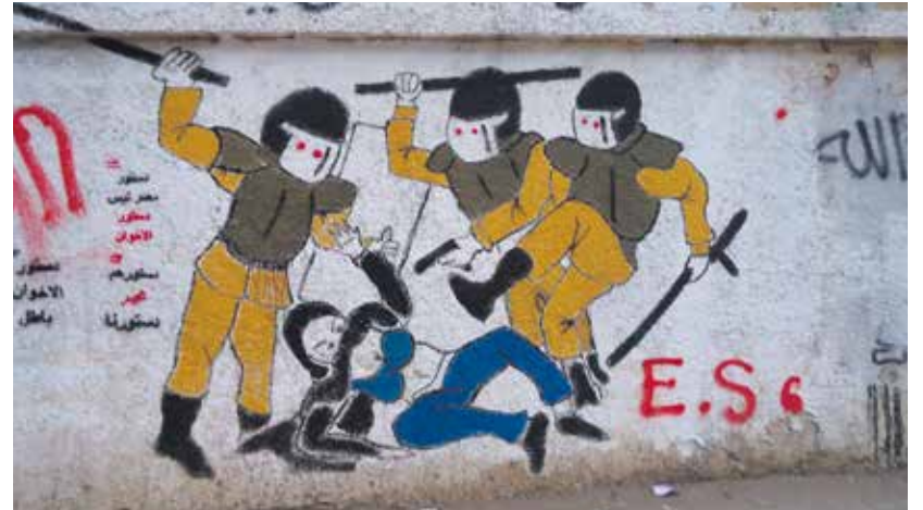
"Je beleeft elke dag de dood binnen in jezelf."