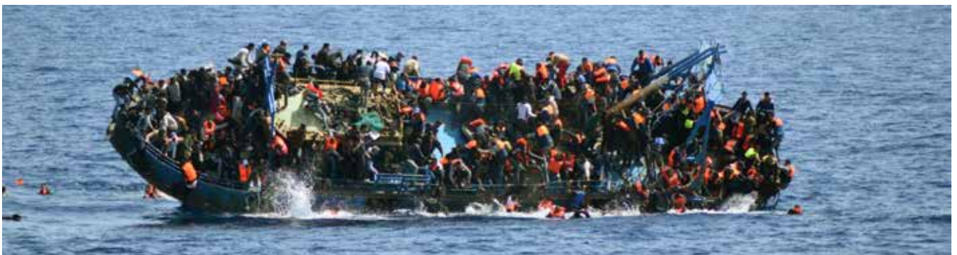
'Onze' mensen helpen mag wat kosten, maar bootvluchtelingen worden teruggeduwd.